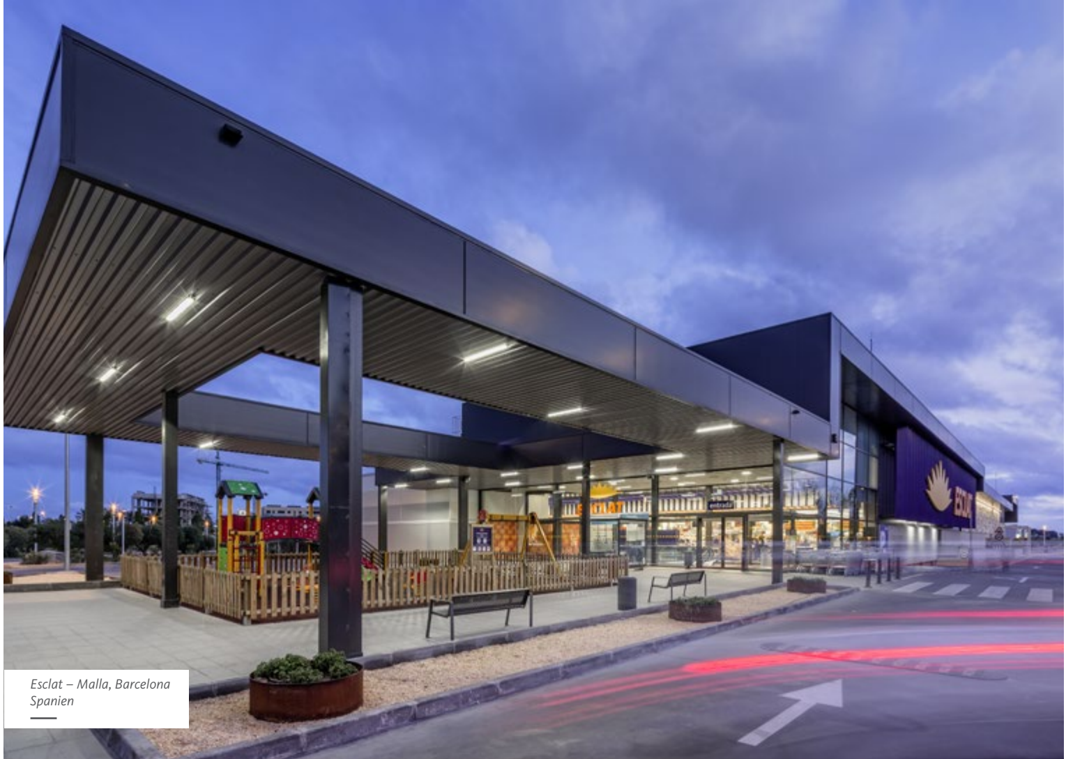
Esclat – Malla, Barcelona Spanien