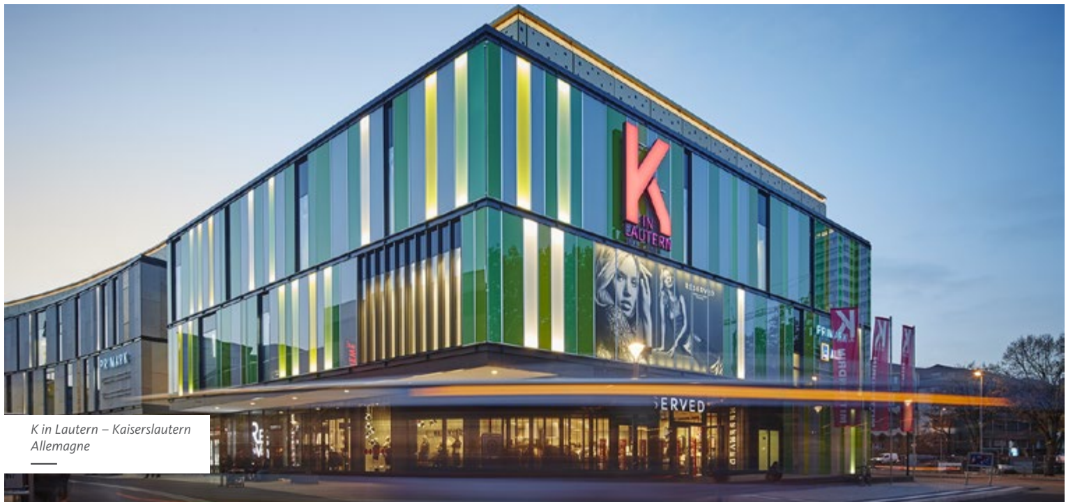
K in Lautern – Kaiserslautern Allemagne