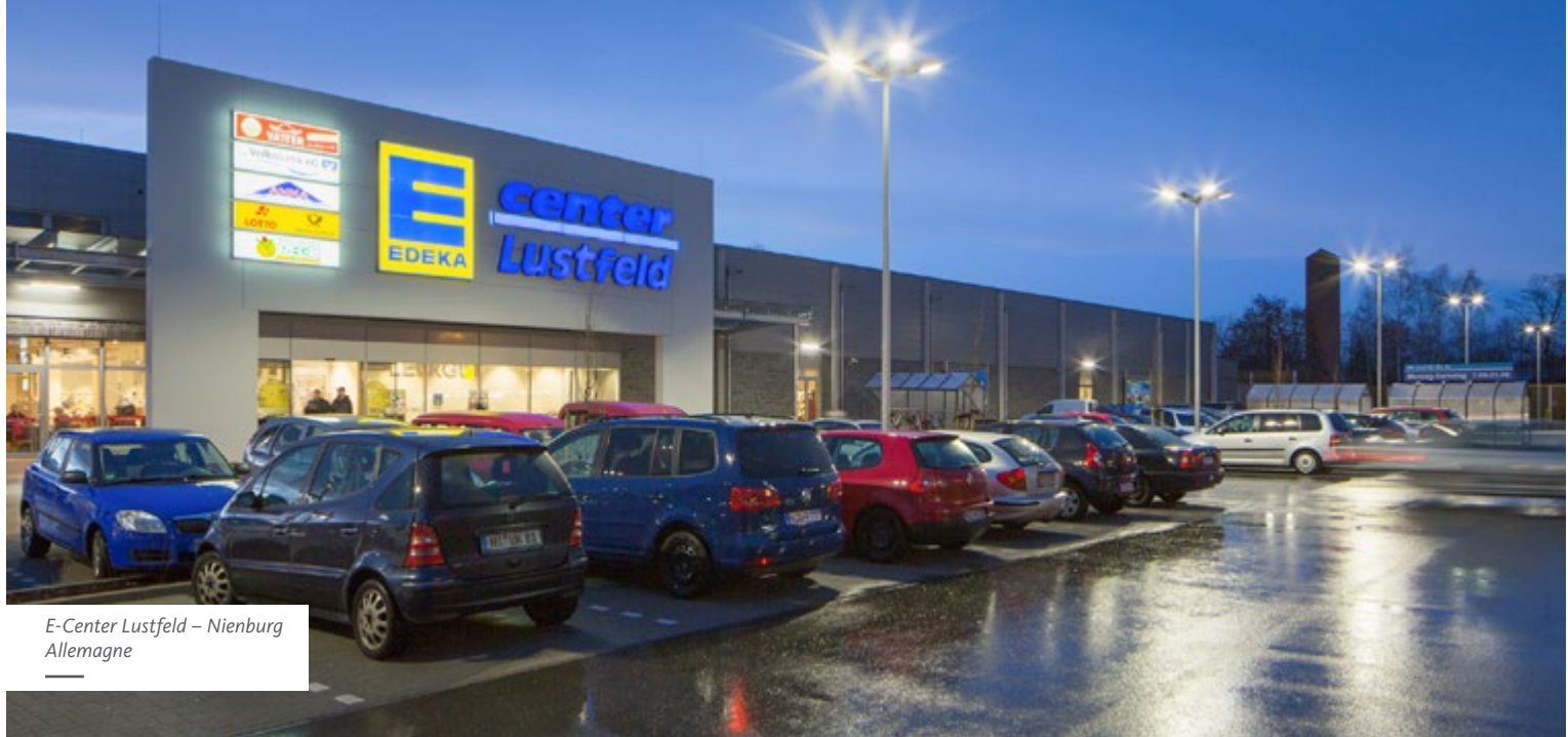
E-Center Lustfeld – Nienburg Allemagne