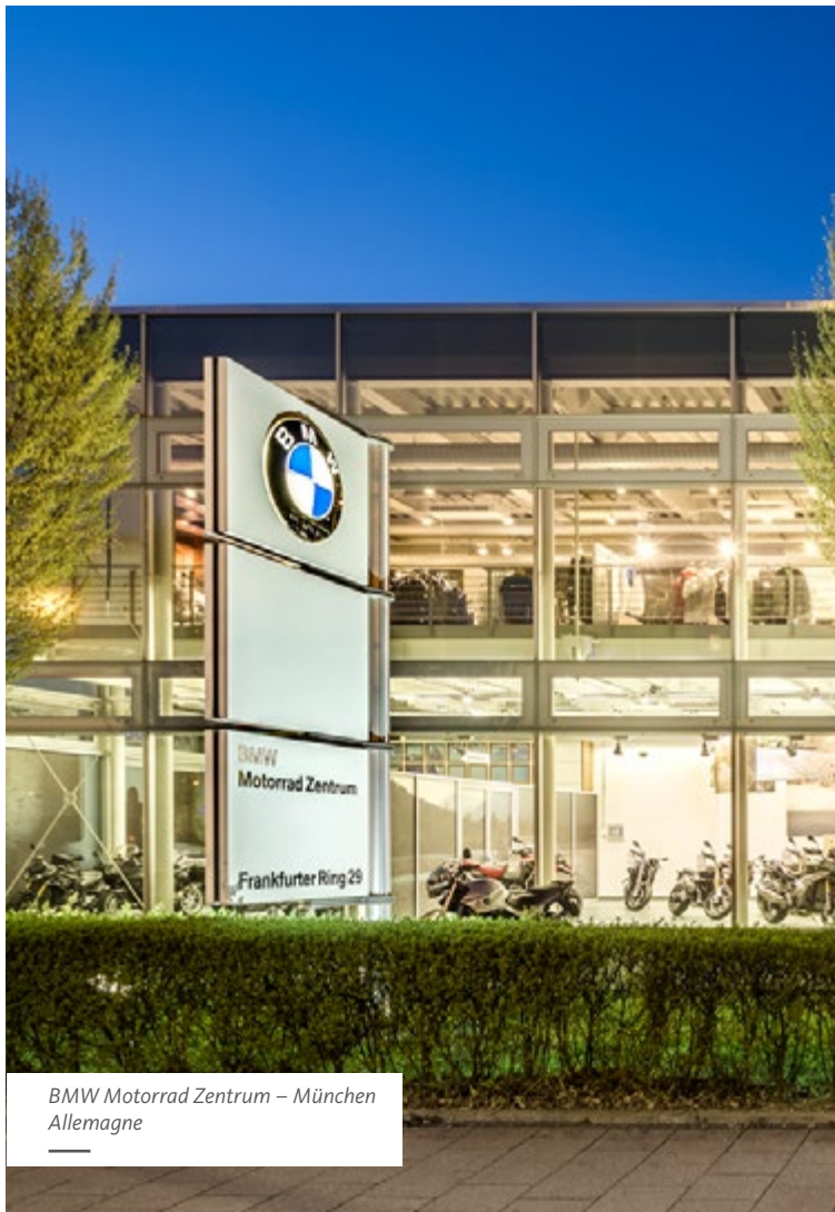
BMW Motorrad Zentrum – München Allemanne