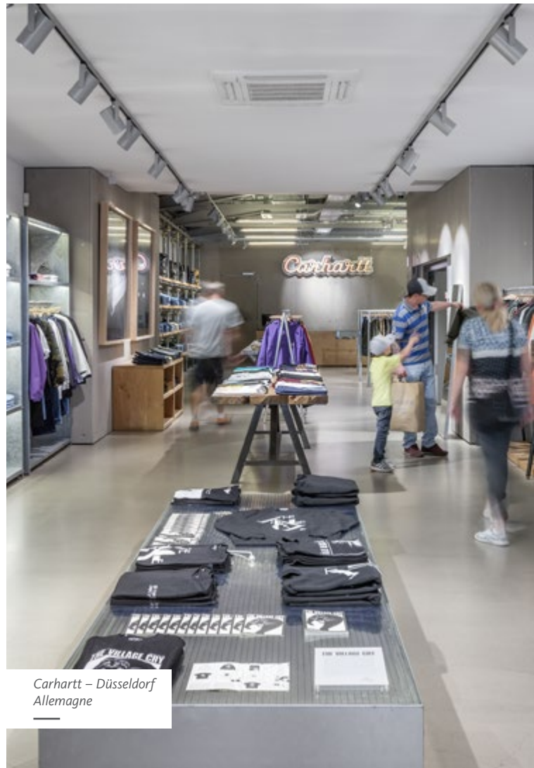
Carhartt – Düsseldorf Allemagne