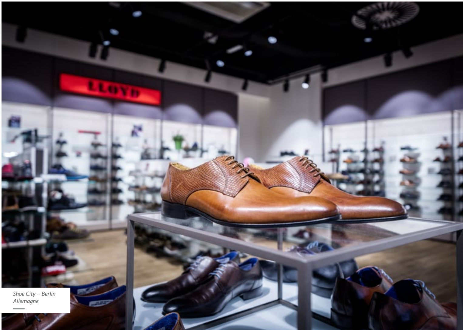
Shoe City – Berlin Allemagne