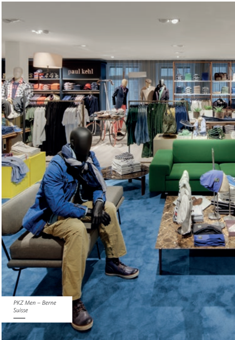
PKZ Men – Berne Suisse