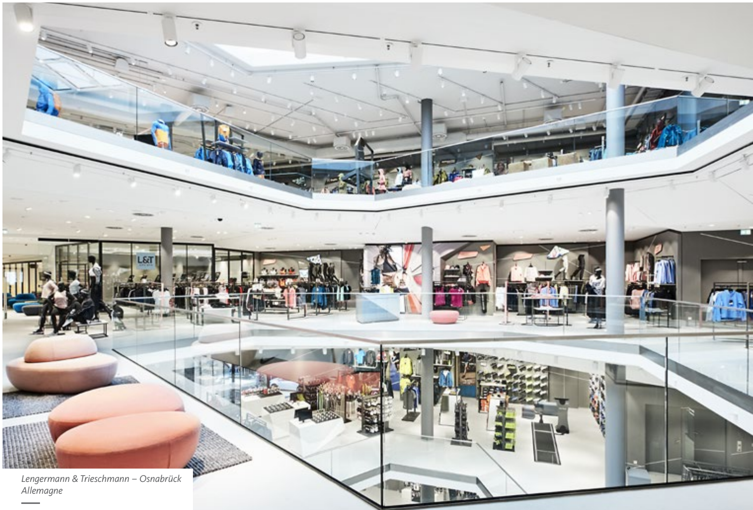
Lengermann & Trieschmann – Osnabrück Allemagne