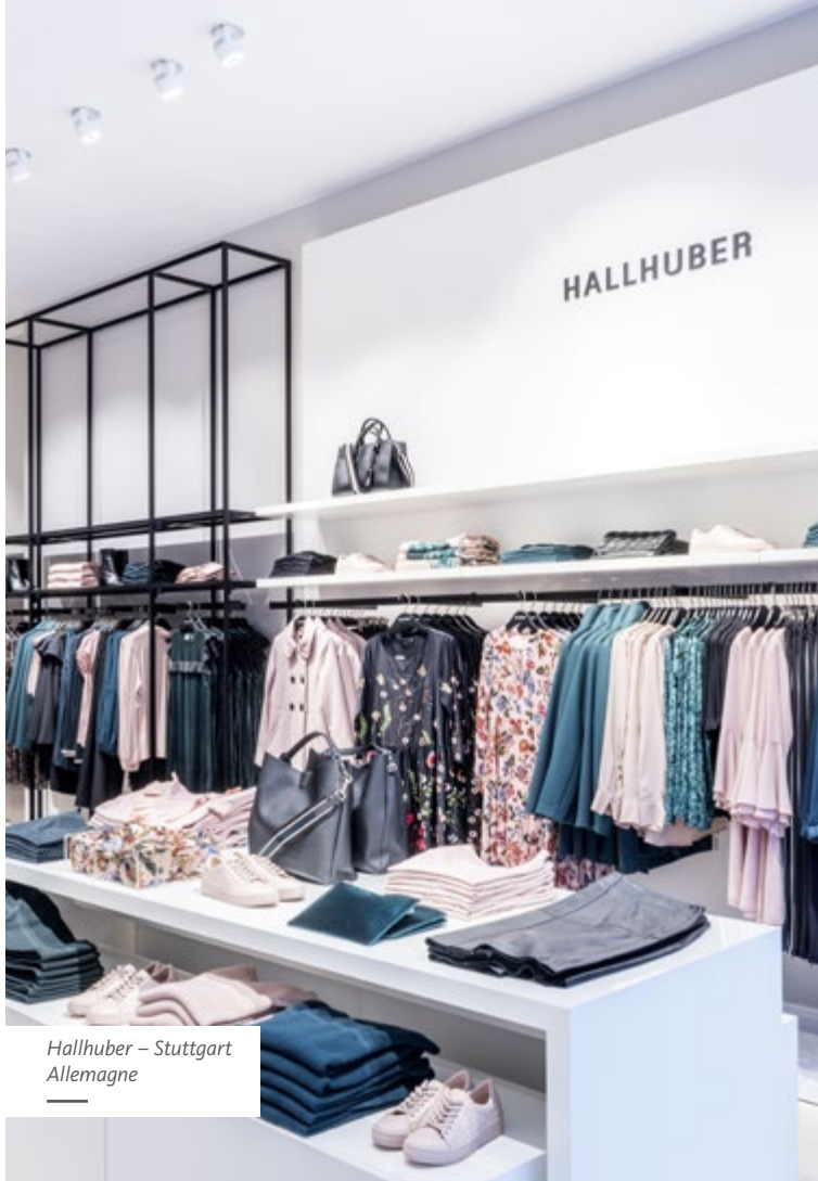
Hallhuber – Stuttgart Allemagne