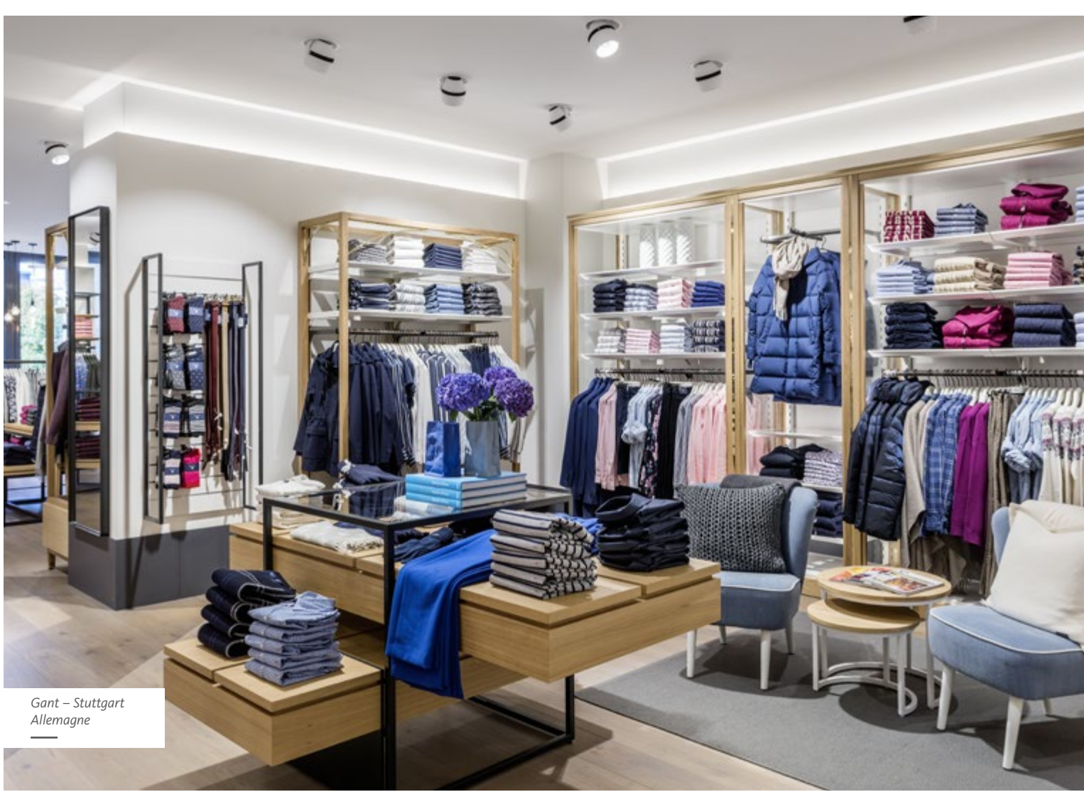
Gant – Stuttgart Allemagne