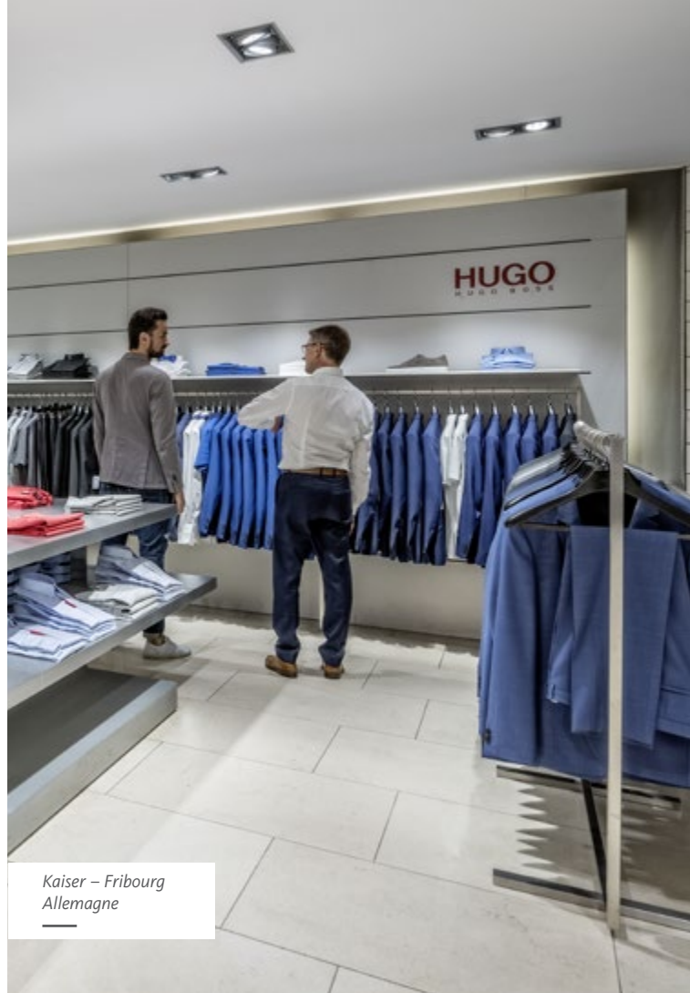
Kaiser – Fribourg Allemagne