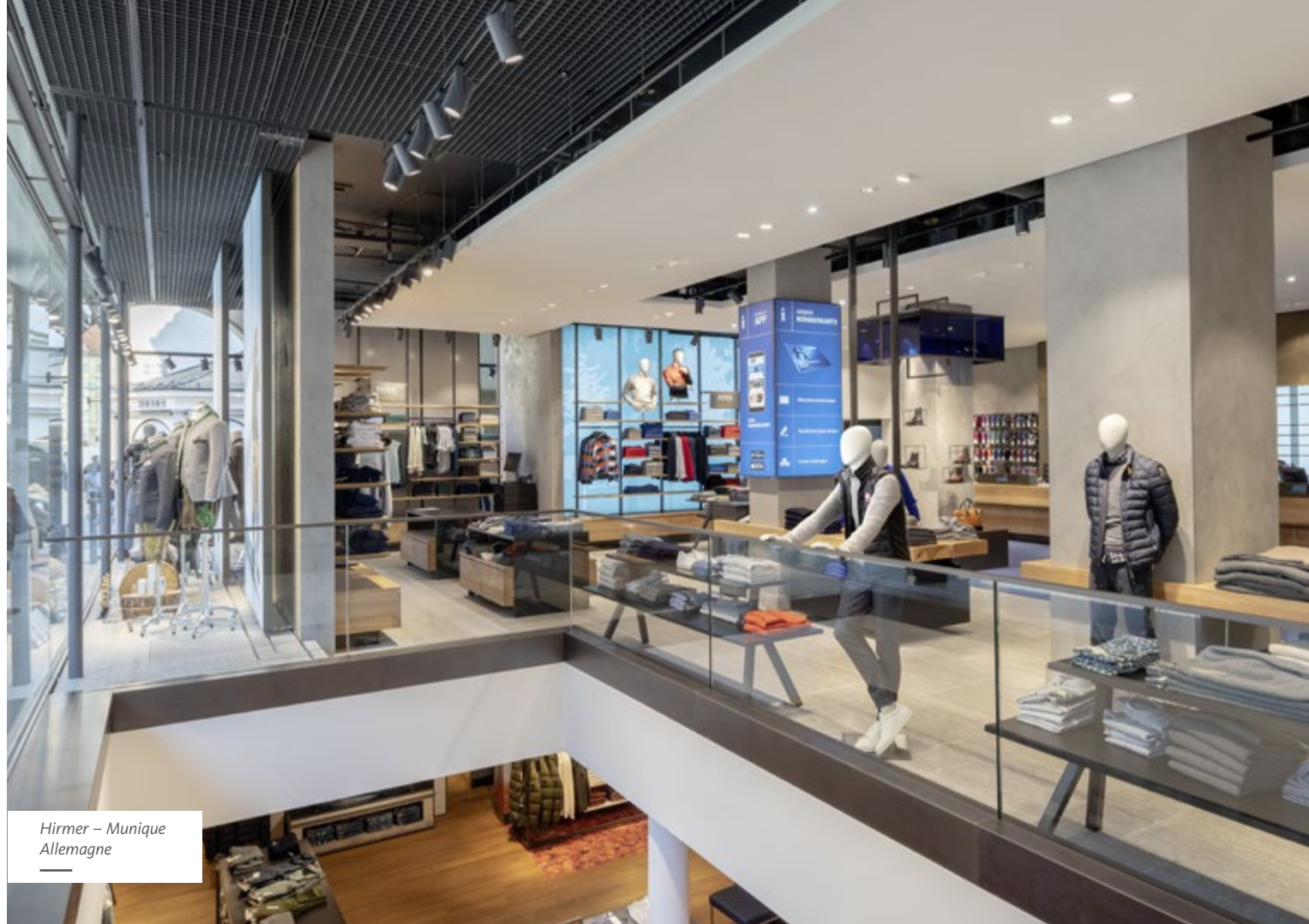
Hirmer – Munique Allemagne