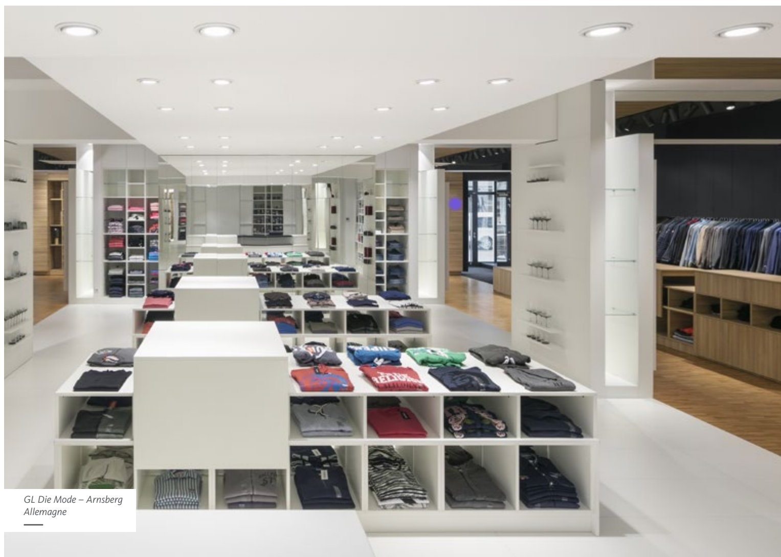
GL Die Mode – Arnberg Allemanne