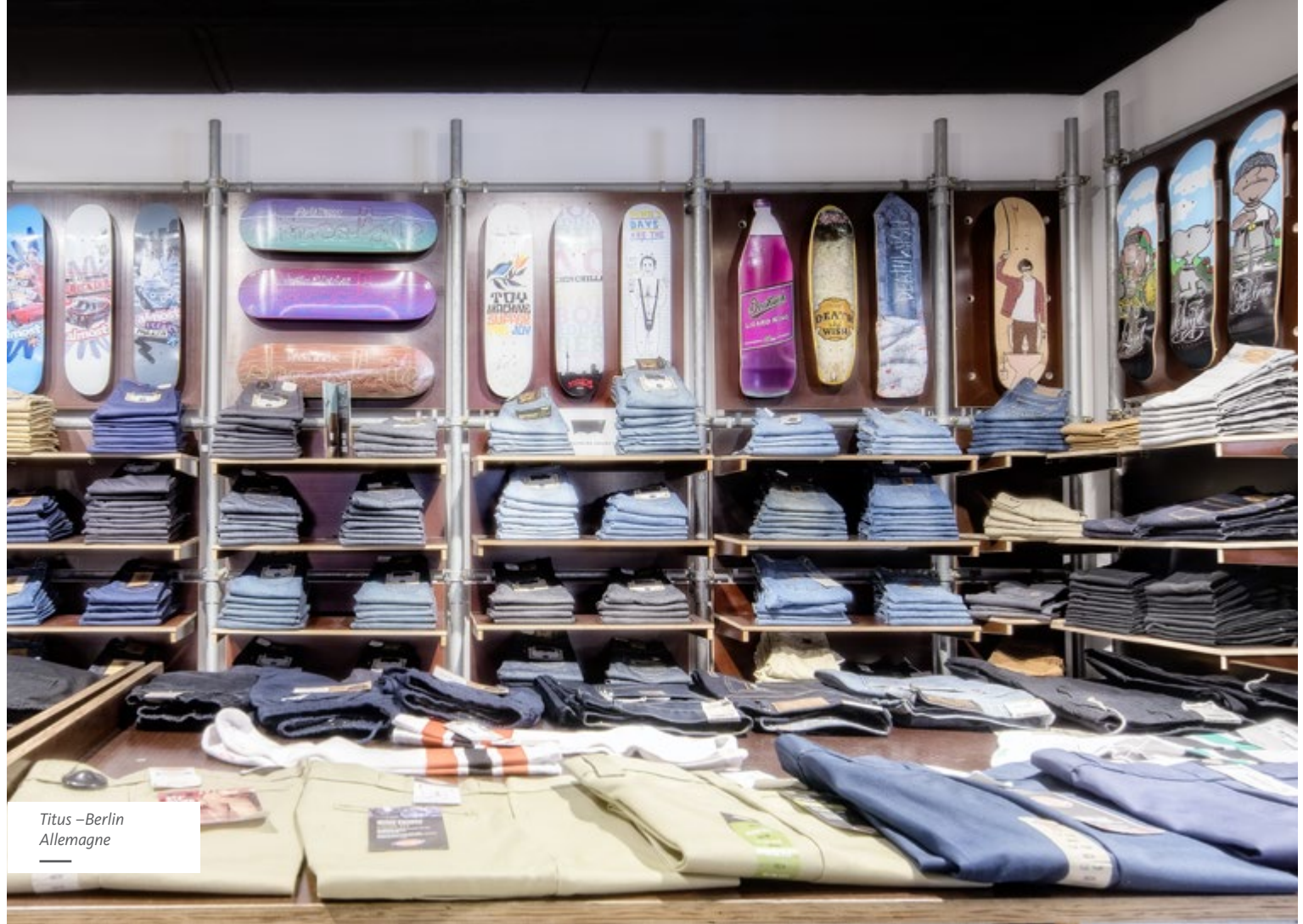
Titus – Berlin Allemagne