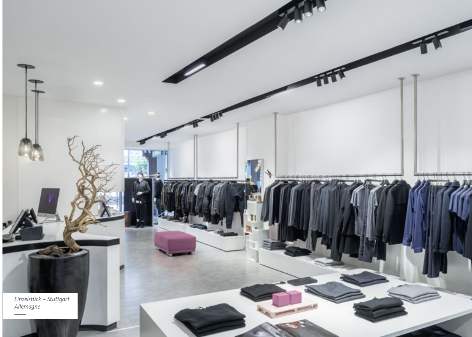
Einzelstück – Stuttgart Allemanne