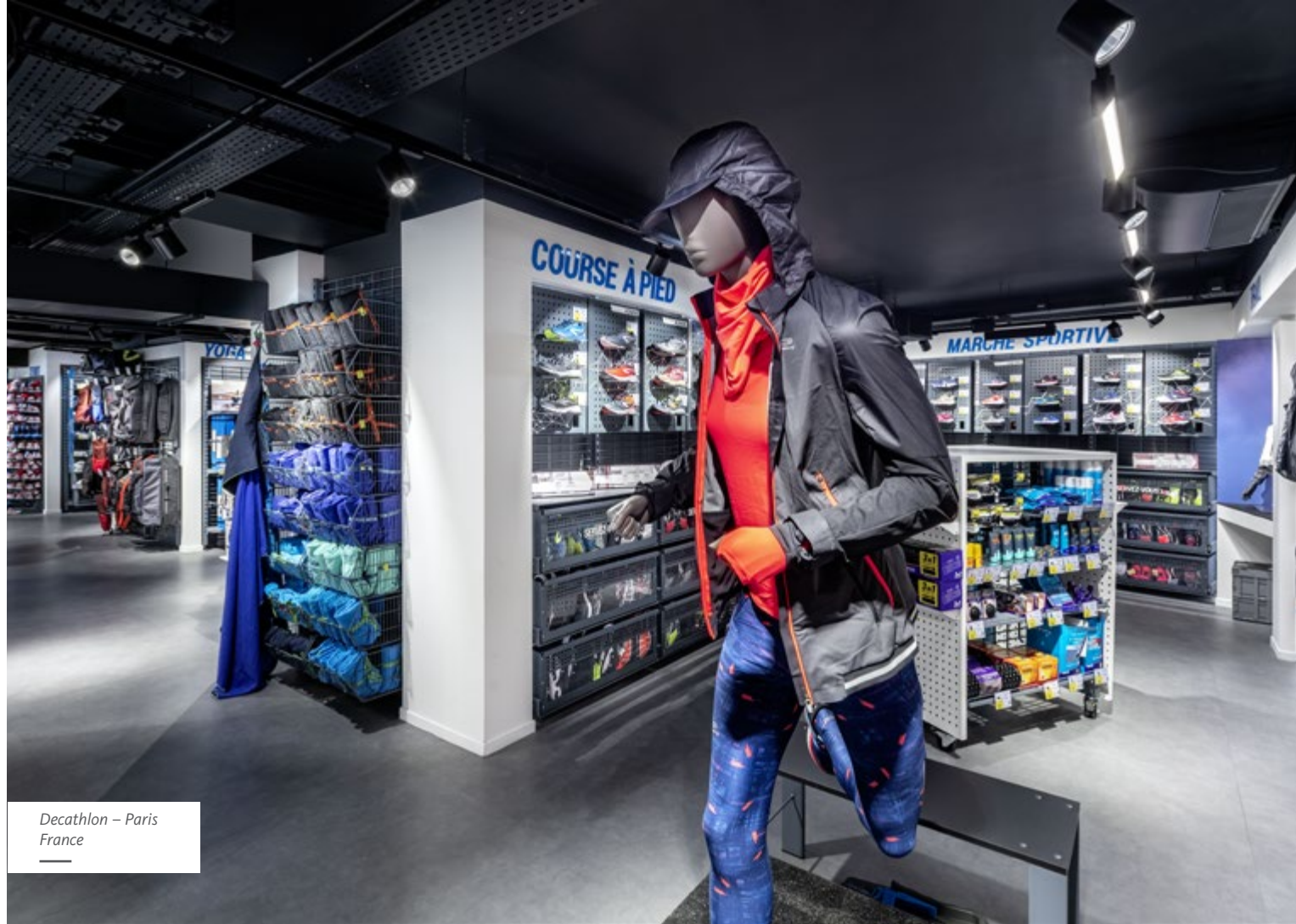
Decathlon – Paris France